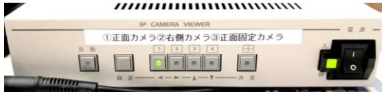
①正面カメラ ②右側カメラ ③正面固定カメラ